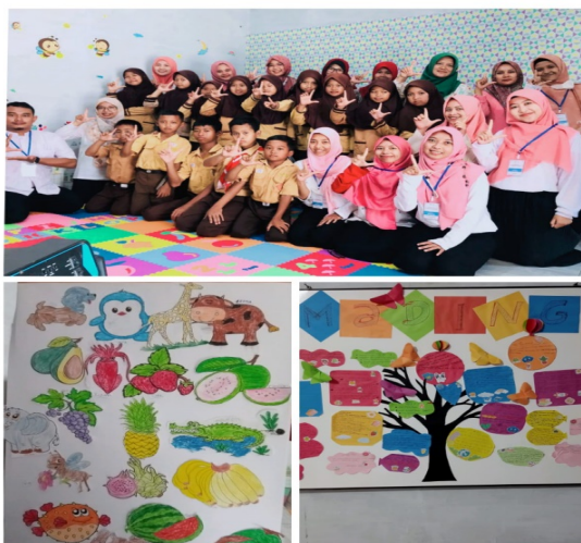
Gambar 1. Hasil Kegiatan Literasi Anak berupa Mading pada Pojok Baca Jungkare

Adapun tantangan pelaksanaan pameran secara online , sebagai berikut: manajemen waktu yang efektif selama pelaksanaan pameran secara online , koordinasi jarak jauh antara anggota kelompok dalam mengatur dan merencanakan pameran, memilih serta mempelajari platform pameran yang sesuai dan merancang strategi efektif dan efisien untuk menarik pengunjung.